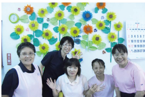
「ひまわりのような笑顔」のステキなスタッフです！

ご利用者様と共にスタッフも全員で、一つのモノを仕上げるのは大変なことでしたが、完成品を目の前になると、皆様も「ひまわりのような笑み」がこぼれておりました。