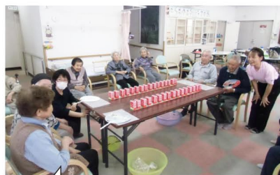
よろしくお願ひしま～す