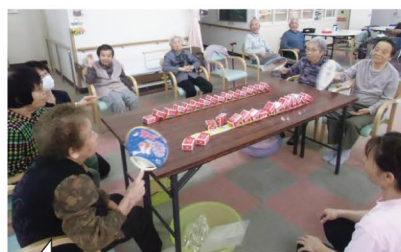
扇ぎ方は、たて？よこ？どっちがよか？ つつい、むきになるねえー！（^-^）