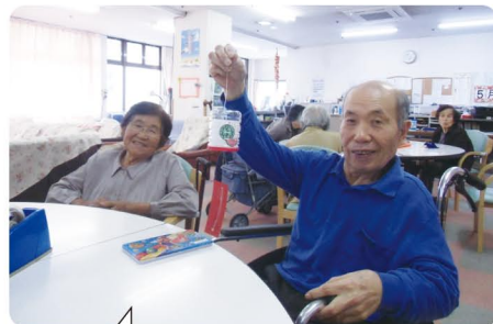
「私のが一番！」どうか～？

本格的な夏を迎えました。夏の到来を前に手工芸でペットボトルを使った風鈴や、フェルトの生地を使ったパッチワークの紫陽花飾りをつくりました。丁寧に塗り仕上げられた風鈴は、鮮やかな彩りと涼しげな音で